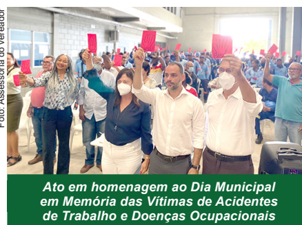
Ato em homenagem ao Dia Municipal em Memória das Vítimas de Acidentes de Trabalho e Doenças Ocupacionais

do Trabalho, Emprego e Renda na Câmara Municipal de Salvador (CMS), assinou um manifesto elaborado por diversos especialistas que contém propostas para a concretização do Sistema Nacional de Saúde do Trabalhador (Sinast).